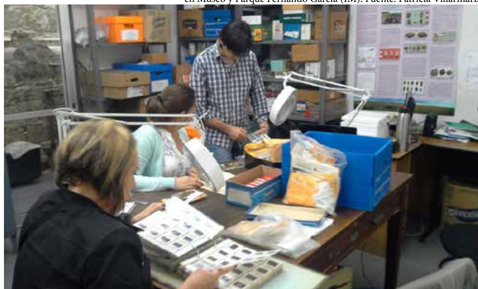
Figura 2. Registro y acondicionamiento de la colección de fotografías y diapositivas de la Comisión de Rescate Arqueológico de Laguna Merín. Pasantía en Laboratorio de Arqueología (FHCE, Udelar).