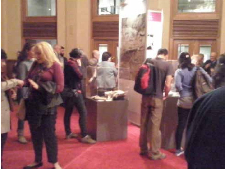
Figura 4. Inauguración exposición «setenta años de FHCE». Pasantía setenta años de FHCE (FHCE, Udelar).