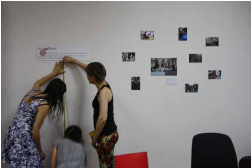
Figura 3. Proceso de montaje de la exposición temporal «Ser Urbano». Pasantía en Espacio Cultural Urbano (MEC-MIDES).