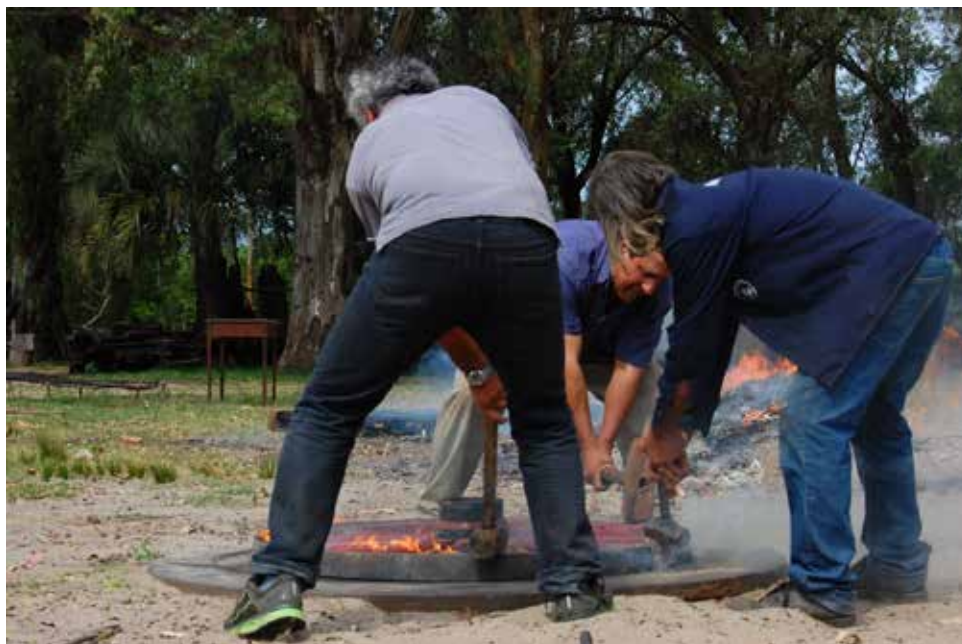
Figura 1. Actividad de enllantado de rueda de carruaje registrada durante el proceso de investigación para la elaboración de proyecto museográfico. Pasantía en Museo y Parque Fernando García (IM).